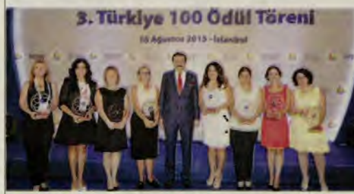
En hızlı büyüyen iş kadınları ödüllerini Hisarcıkhoğlu'ndan aldı