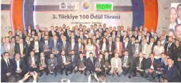
Satış gelirlerindeki artış hızına göre belirlenen Türkiye'nin en hızlı büyüyen 100 şirketi arasında, Gaziantep'ten de 3 firma yer aldı. Gaziantep'li firmalar Işık Ahşap Profil 82'inci, Aktif Tekstil 96'ıncı ve Mespa Sağlık Malzemeleri 97'inci sıradan listeye yerleşti.