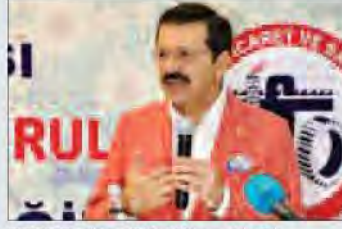
TOBB Başkanı Rifat Hisarcıkloğlu