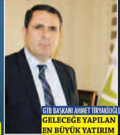
GTB BAŞKANI AHMET TİRYAKIOĞLU