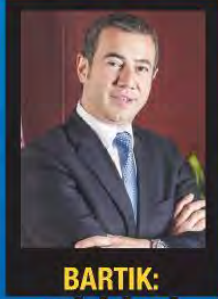
BARTIK: "GİRİŞİMCİ RUHUN KENTİ"