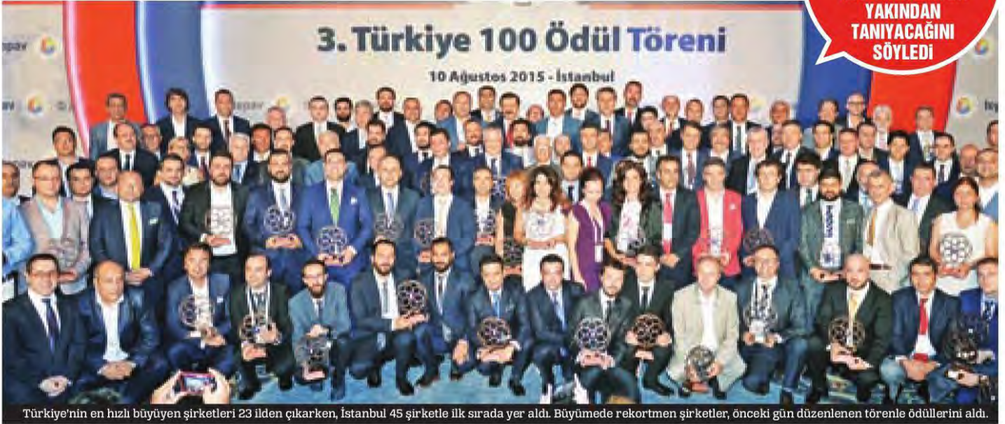
Türkiye'nin en hızlı büyüyen şirketleri 23 ilden çıkarken, İstanbul 45 şirketle ilk sırada yer aldı. Büyümede rekortmen şirketler, önceki gün düzenlenen törenle ödüllerini aldı.

TOBB BAŞKANI, ŞİRKETLERİN ABD'YE DÜZENLENECEK İŞ SEYAHATI İLE ABD PAZARINI DA YAKINDAN TANIYACAĞINI SÖYLEDİ