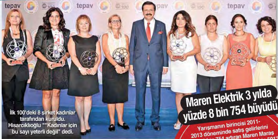
İlk 100'deki 8 şirket kadınlar tarafından kuruldu. Hisarcıkıoğlu "'Kadınlar için bu sayı yeterli değil" dedi.

TÜSİAD, uzlaşma arayışlarının ısrarla sürdürülmesini, kurulacak hükümetin demokratik, ekonomik ve sosyal açıdan Türkiye'nin gelişmişlik düzeyini ilerletecek adımları atmasını istedi.