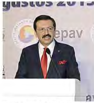
TOBB President Rifat Hisarcıklođlu is seen giving a speech at a ceremony.