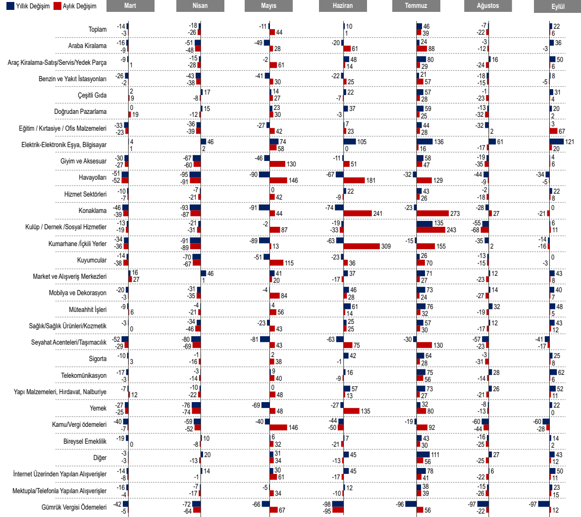
Şekil 2 Banka kartı ve kredi kartı ile yapılan harcama tutarının aylara göre aylık ve yıllık değişimleri, %, Mart – Eylül 2020