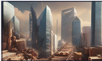
Türkiye'de hangi iller bölgesel kalkınma tuzağında?