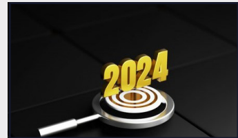
2024 Yılı Ekonomik Görünümü