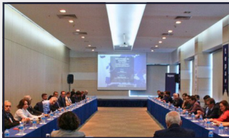
Türkiye ve Avrupa stratejik özerklik arayışında nerede?